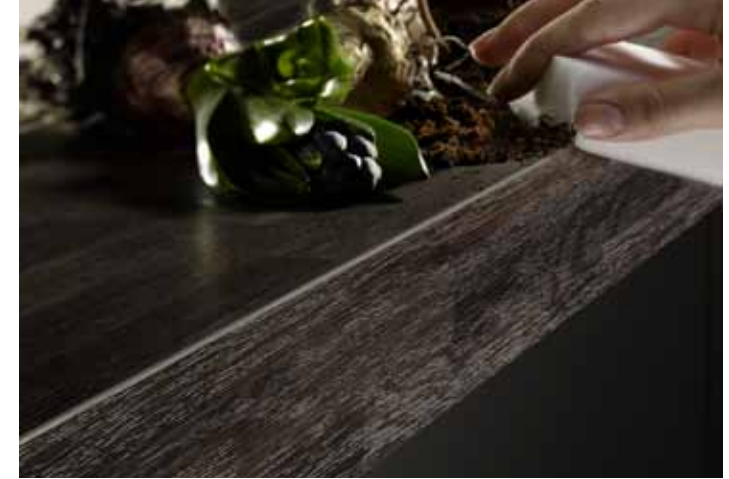
Die versiegelte Kante ist schnell und einfach zu reinigen. | The sealed edge can be cleaned quickly and easily.

Moisture and dirt are a thing of the past.