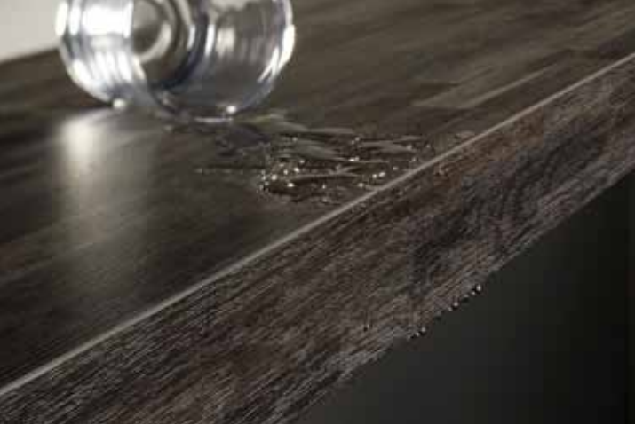
Der Döllken AQUA-STOP-PEN sorgt für eine wasserdichte Versiegelung. | Döllken AQUA-STOP-PEN ensures a watertight seal.