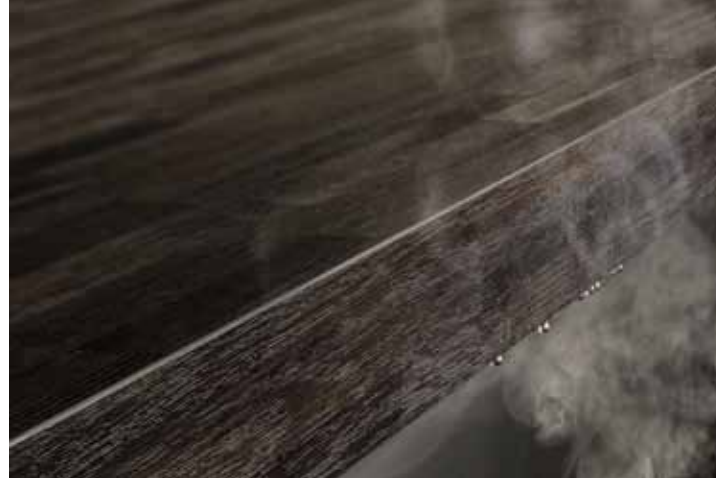
Auch Wasserdampf stellt ab sofort keine Gefahr mehr dar. | Steam too is no longer a problem.

Feuchtigkeit und Schmutz haben keine Chance mehr.